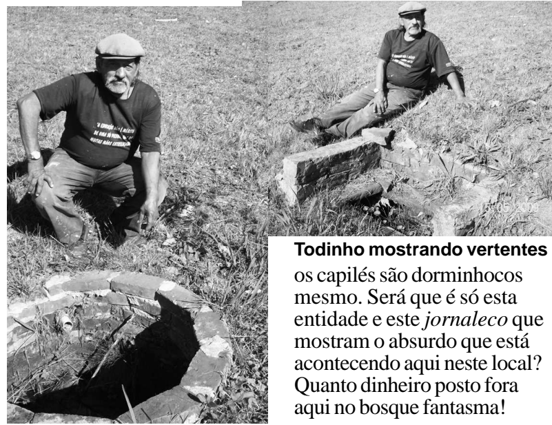
Todinho mostrando vertentes os capilés são dorminhocos mesmo. Será que é só esta entidade e este jornaleco que mostram o absurdo que está acontecendo aqui neste local? Quanto dinheiro posto fora aqui no bosque fantasma!

Os dois comandantes das fragatas pediram para falar do bosque fantasma, alegando que